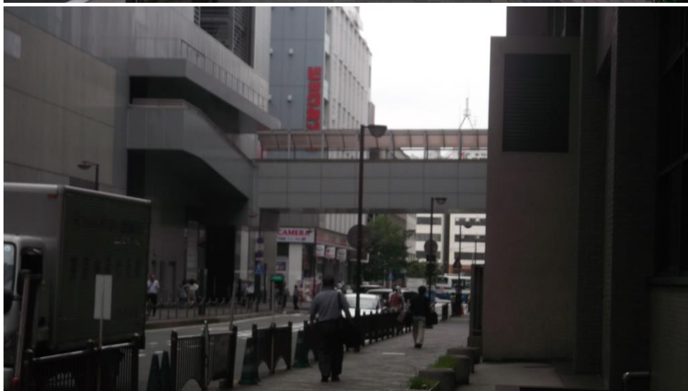
⑤右手にキャンパスプラザ京都が見えます。(ビックカメラの向かいです)